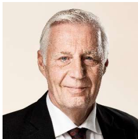
Henrik Dam Kristensen (S)