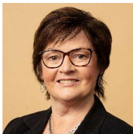
Anni Matthiesen, MF (V)