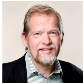
Christian Juhl (Ø)