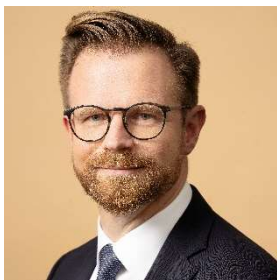
Benny Engelbrecht, MF (S) Formand

Efter Folketingsvalget blev der i januar 2023 nedsat et nyt Sydslesvigudvalg. Det betød et farvel til Birgitte Vind, Karina Lorenzen Dehnhardt, Merete Dea Larsen og Rune Christiansen. Det nye udvalg fremgår af oversigten herunder: