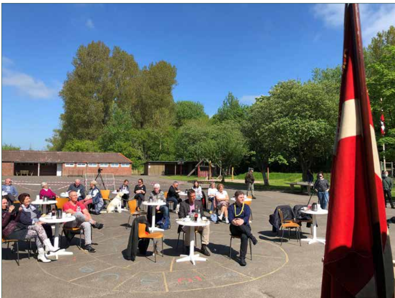
Årsmøder i Sydslesvig 2021.

Beretningen indledes med en kort præsentation af Sydslesvigudvalget, og derefter introduceres udvalgets overordnede opgaver. Dernæst følger en beskrivelse af årets konkrete opgaver, herunder udarbejdelse af resultataftaler for 2022, projekttilskud 2021, den årlige besigtigelsestus m.v.