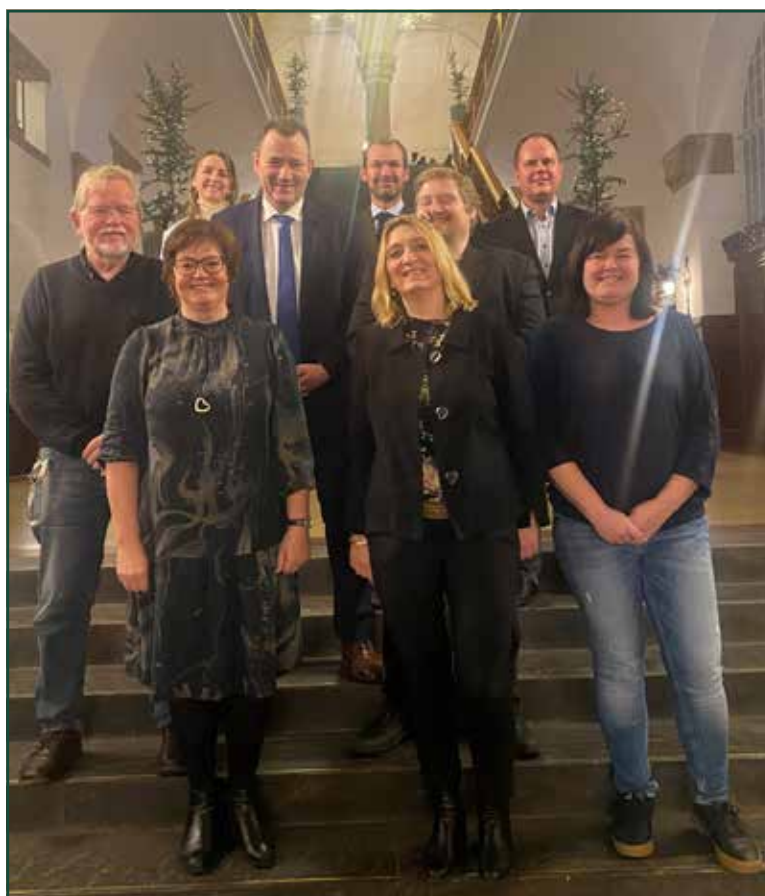
Sydslesvigudvalget og dets sekretariat.

Aktuel status: på grund af COVID-19 epidemien lykkedes det ikke at realisere alle projektets målsætninger i 2021, ligesom bl.a. en skolerejse til Sydslesvig først finder sted i 2022.