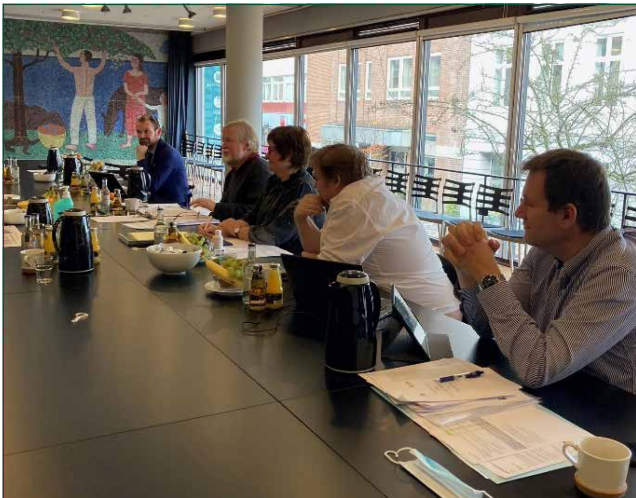
Budgetmøde på Dansk Centralbibliotek 2021.

Her skulle de gøre status over målopfyldelsen pr. 1. juli 2021, ligesom de skulle redegøre for deres forventede målopfyldelse ved udgangen af året.