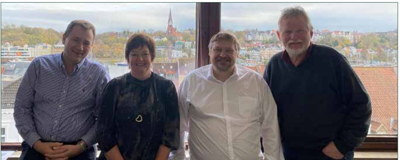
Forhandlergruppen i Flensborg.

Den 19. marts 2021 var der frist for at søge om at indgå en resultataftale med udvalget i 2022. Neden for ses de ni foreninger, som ansøgte om driftstilskud via en resultataftale.