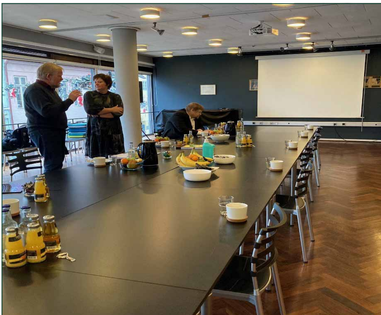
Budgetmøde på Dansk Centralbibliotek 2021.