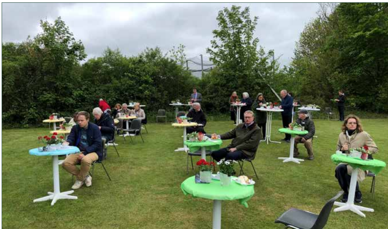
Årsmøde på Mikkelberg 2021.